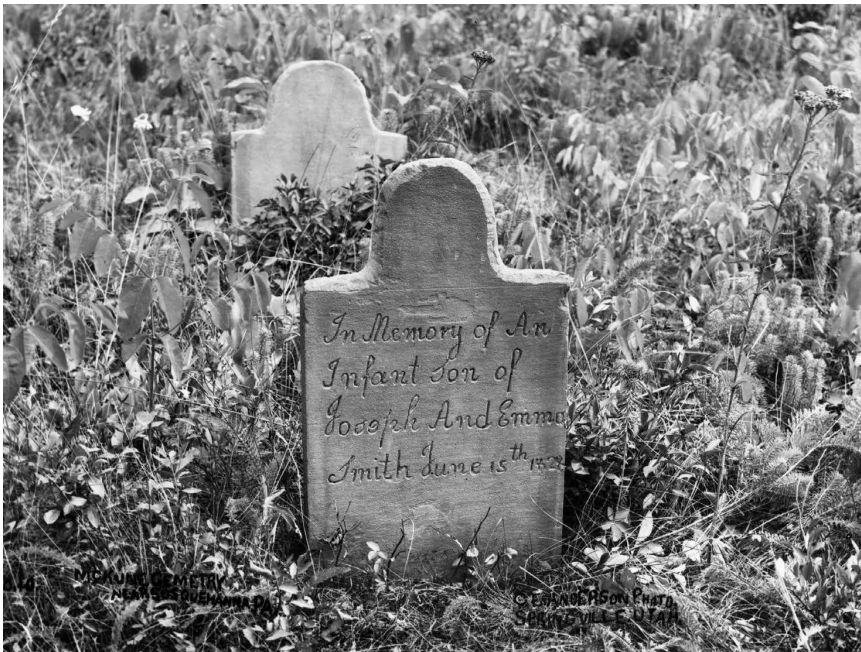
Gravsten som markerar Alvin Smiths, Joseph och Emmas Smiths nyfödda barns grav.

Be eleverna tänka på hur sanningen som uppenbaras i vers 10 kan trösta familjer som sörjer ett barns död. Du skulle kunna ge dem tid att begrunda upplevelser som de eller deras släktingar har haft när de ha tröstats av den här sanningen.