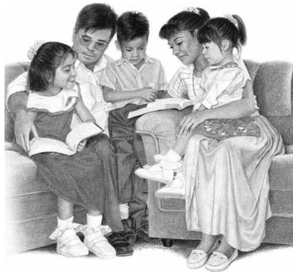
Föräldrar ska lära sina barn att be och vandra uppriktigt inför Herren.

Vad betyder "helig skrift"? Vad är syftet med missionsarbete, och vilken kraft har missionärer? Vem kan kallas som biskop och vad har detta att göra med Arons bokstavliga efterkommande? Vilka huvudsakliga ansvar har föräldrar? Vilka av de heligas problem sade Herren att han inte fann "behag i"? Sök noggrant efter svaren på dessa frågor när du läser Lärnan och förbunden 68.