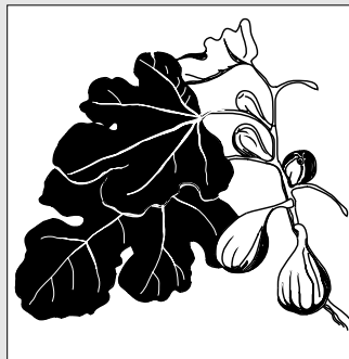
Fikongren med fikon

Jesus förklarade inte varför han förbannade fikonträdet, men lite kunskap om fikonträd, tillsammans med de omständigheter som beskrivs i skrifterna, hjälper oss förstå symboliken i det som Jesus gjorde. Det slags fikonträd som nämns i Markus 11 frambringar tidiga fikon, även innan det har fullt med blad. Den stora fikonskörden kommer senare. Om ett träd inte frambringar tidiga fikon kommer det inte alls att